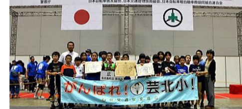
第50回 交通安全子供自転車全国大会

第50回の節目を迎えた交通安全子供自転車全国大会(全日本交通安全協会主催、地区予選出場は1379チーム)。1チーム4名で、交通規則などの学科テストと、安全走行や技能走行(S字やデコボコ道)などの実技テストで順位を争います。