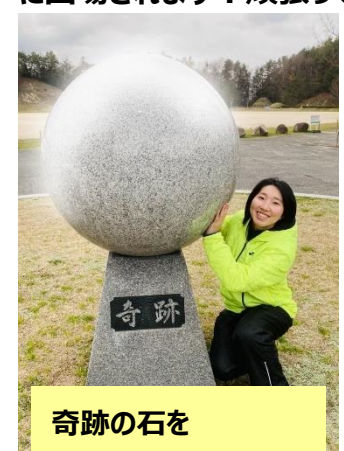
奇跡の石を触りに来た際の写真