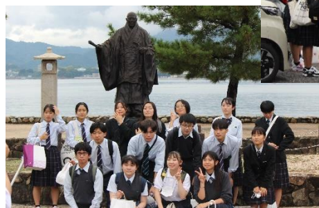
▲千代田高校の生徒とのお別れ