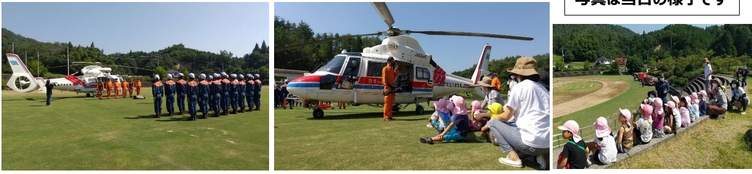
写真は当日の様子です

またこの日は町内の保育園児も訓練の様子を見に来ており、目をキラキラさせながら大迫力のヘリコプターや消防士の方の動きを見ていました！