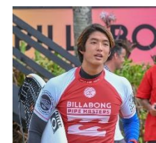
五十嵐カノア(いがらしかのあ)選手

1998年2月15日生まれ、ハワイ出身。ハワイに移住した日本人の両親の元で生まれ育った前田選手。15歳の時に世界ジュニア選手権で優勝し、2018年ワールドランキングは1位。