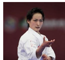
形 清水希容(しみずきよ)選手

また現在世界大会で金メダルを獲得している選手もおり、東京2020大会でも金メダルが期待されている！ちなみに美男美女が多い事でも注目されている。