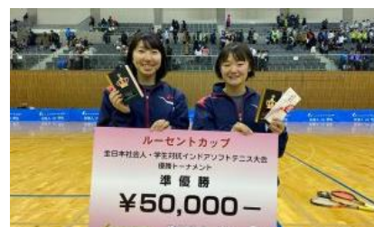
社会人対学生インドア